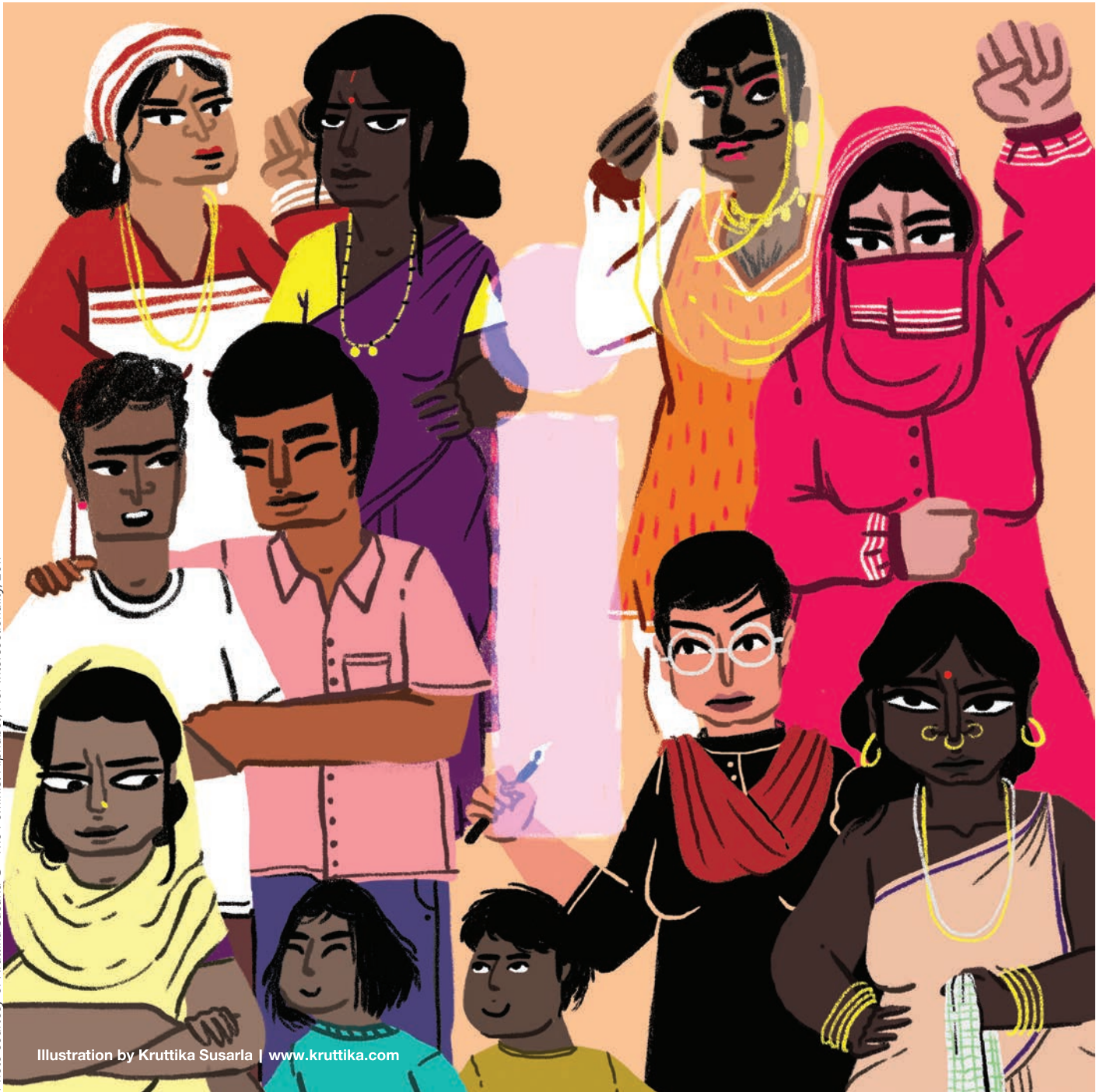
Photo courtesy of Kruttika Susarla © - The Feminist Alphabet, / for Intersectionality, 2017

COLLOQUE INTERNATIONAL / INTERNATIONAL CONFERENCE