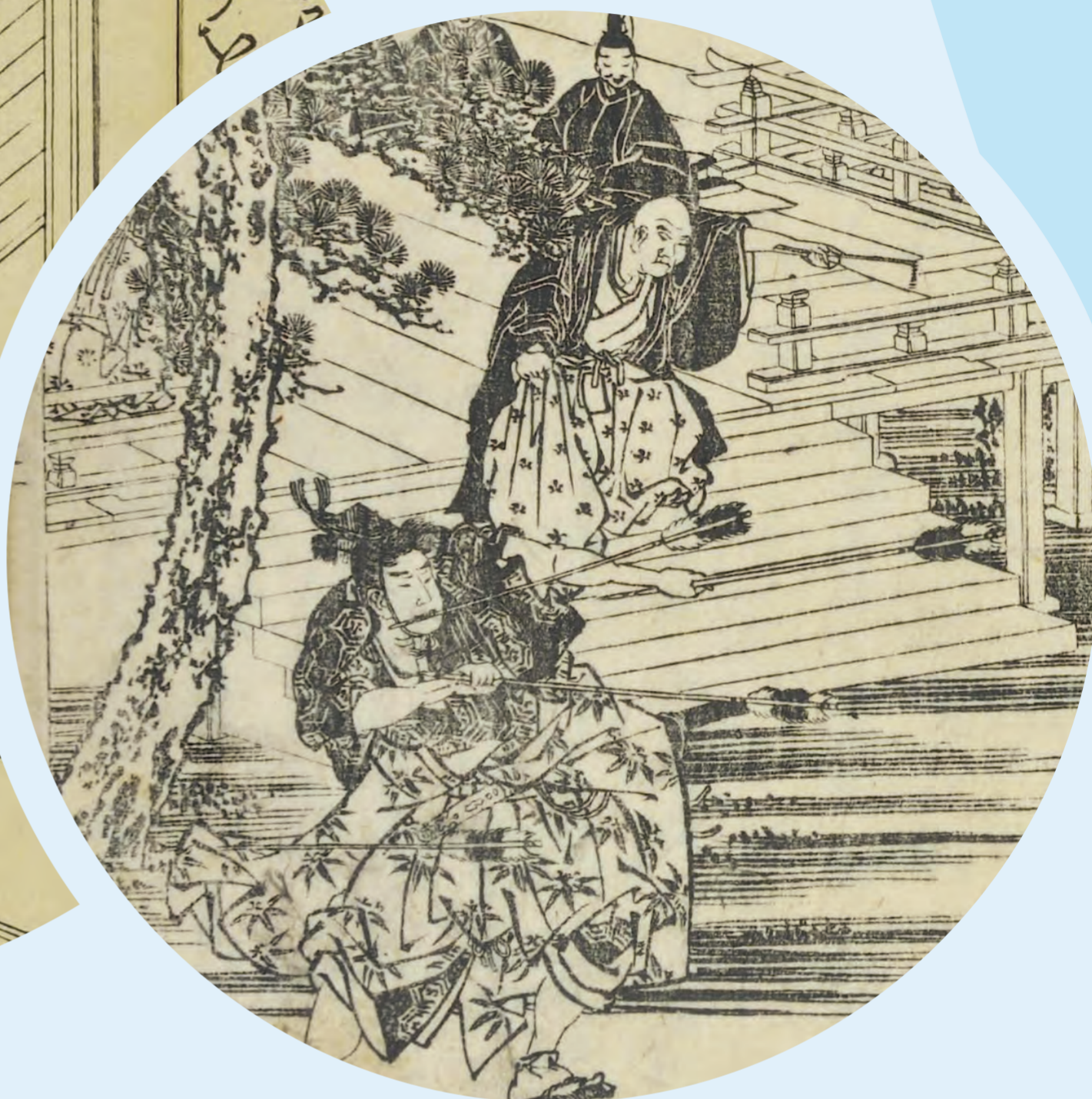
Kyokutei Bakin and Katsushika Hokusai, Chinsetsu yumiharizuki